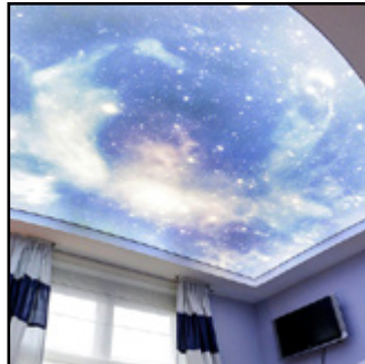
LED-Lichtdecken / Wände