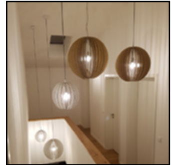
Leuchten aus Holz